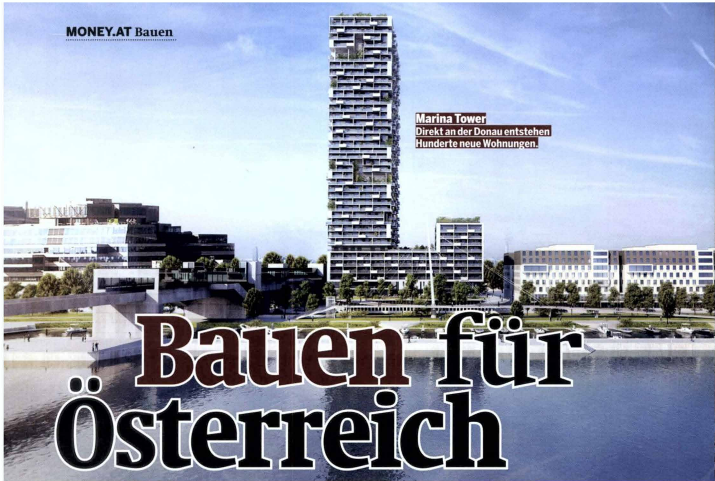
Marina Tower Direkt an der Donau entstehen Hunderte neue Wohnungen.