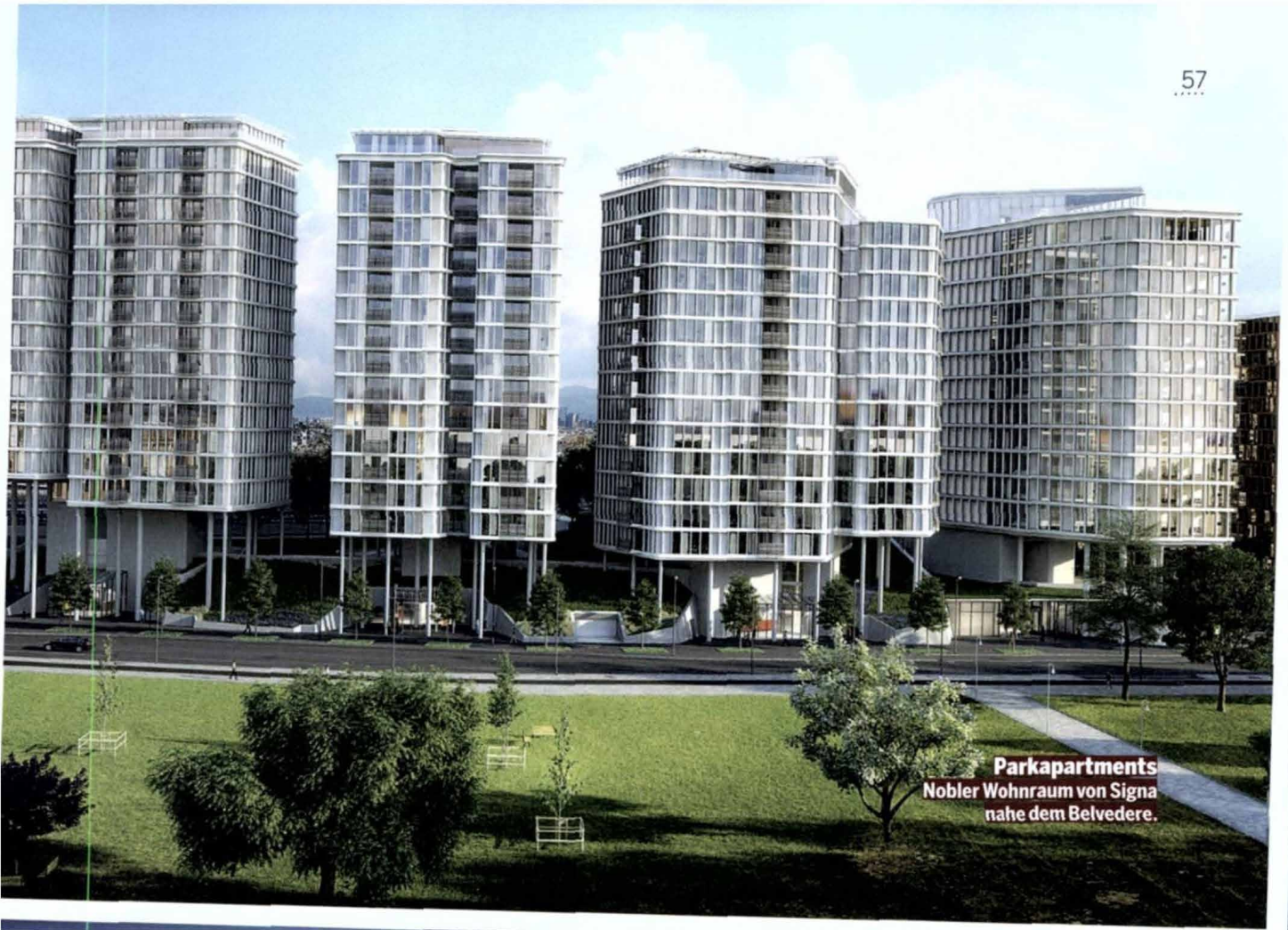
Parkapartments Nobler Wohnraum von Signa nahe dem Belvedere.